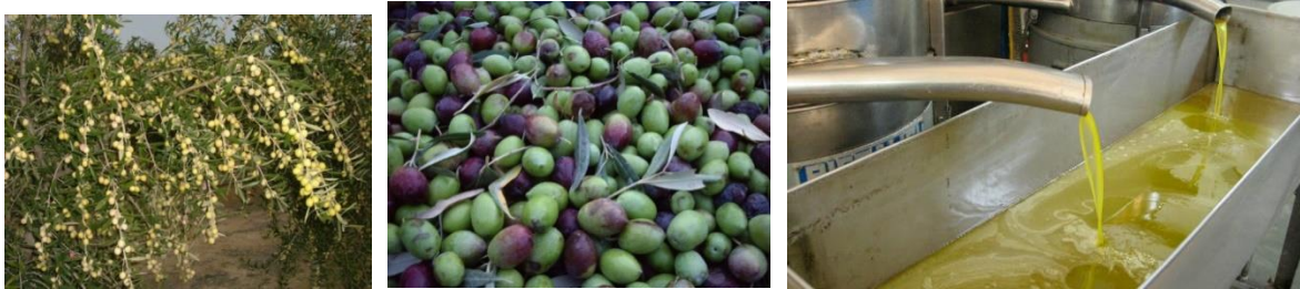
Zeytin ve zeytinyağı

Zeytinyağı: Zeytinyağını diğer bitkisel yağlardan ayıran en önemli iki özelliği; meyveden elde edilmesi ve hiçbir kimyasal işleme tabi tutulmaksızın tamamen fiziksel işlemlerle mekanik olarak elde edilip, doğal haliyle tüketilebilir niteliklere sahip olmasıdır. Zeytin ağacının, doğrudan meyvesinden sıkılarak; hiçbir kimyasal işlem görmeden, katkı maddesi içermeden, doğal hali ile elde edilen, oda sıcaklığında sıvı olarak tüketilebilen, yeşilimsi, sarımtırak renkte, sıvı bir yağdır. Ayçiçeği, soya, pamuk çekirdeği, mısırözü gibi bitkisel yağlardan farkı da, doğal yollardan üretilmesidir. Zeytinyağı, zeytinin etli meyvesinin, çekirdeğiyle birlikte sıkılmasıyla elde edildiği için, tohumlardan elde edilen diğer yemeklik yağların aksine; bir "meyve suyu" dur. Zeytinin, ezilen ve parçalanmış tane hücreleri; patlayarak, yağın dışarı verir. Taze sıkılmış portakal ya da vişne suyu gibi, çiğ ve saftır.