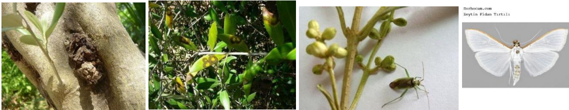
A-Zeytin dal kanseri, B-Halkalı leke hastalığı, C-Çiçek sap sokanı, D-Fidan tırtılı.

Zeytin zararlıları: Çiçek sap sokanı, fidan tırtılı, filizkırın, zeytin güvesi, kabuklu bit, kara koşnili, zeytin kurdu, pamuklu bit, pamuklu koşnili, zeytin sineği, yara koşnili, kırlangıç böceği, zeytin kızılkurdu, zeytin güvesi ve sineği.