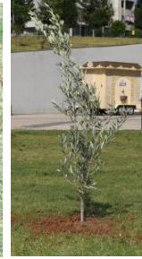
Zeytin fidanı dikimi

Toprak işleme: Toprak işleme zamanında ve uygun şekilde yapılırsa toprağın havalanması, yağış sularının muhafazası ve biyolojik faaliyetlerin artması sağlanmış olur. Zeytinliklerde yılda 2-3 kez toprak işleme yeterli olmaktadır. İlk toprak işleme hasattan sonra toprak tavında iken pullukla 15 cm derinliğinde; ikincisi ilkbaharda 10-12 cm'yi geçmeyecek şekilde pulluk veya tırmıkla, üçüncü işleme ise dökülen zeytinlerin kaybını önlemek amacı ile toprağın düzeltilmesi ve otların temizliği için yapılmaktadır.